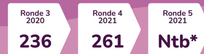
Aantal uitkeringen per ronde:

Aandacht voor relaties en seksualiteit is al vanaf jonge leeftijd belangrijk. Zowel thuis als op school. Hierdoor krijgen kinderen en jongeren op tijd informatie over onderwerpen als gezonde relaties, fijn en veilig vrijen en grensoverschrijdend gedrag. Ook durven zij vragen te stellen over seksuele en genderdiversiteit, sexting, wensen en grenzen. Dit draagt bij aan een positieve en gezonde seksuele ontwikkeling. De stimuleringsregeling Gezonde Relaties & Seksualiteit is erop gericht om scholen die aandacht willen besteden aan het thema Relaties en seksualiteit te stimuleren en ondersteunen.